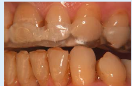
Abb. 8 ▲ Eingestellte sagittale Protektion bei Laterotrusion auf der fertiggestellten Schiene. Dorsalprotektiv zur Entlastung der bilaminären Zonen