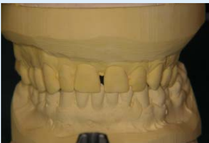
Abb. 9 ▲ Remontierte Modelle nach vier Physiotherapiesitzungen in Zentrik, frontal. Die Unterkieferschwenkung ist sich langsam rückläufig