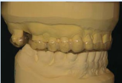
Abb. 6 ▲ Oberkieferschiene rechts