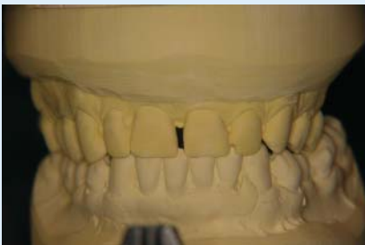
Abb. 1 ▲ Ausgangssituationsmodell HIKP frontal

Im Internet sind Informationen zur CMD-Therapie sowie ein neu eingerichtetes und im Wachstum befindliches CMD-Therapeutenregister mit der Möglichkeit der eigenen Eintragung unter www.cmd-therapie.de kürzlich eingerichtet worden.