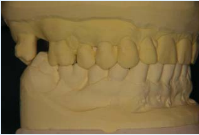
Abb. 3 ▲ Ausgangssituationsmodell HIKP rechts