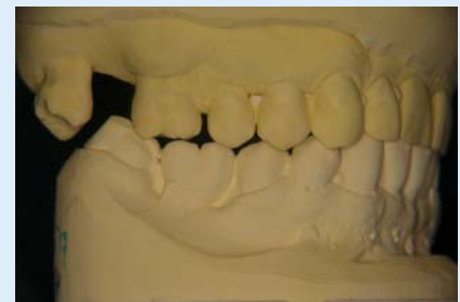
Abb. 11 ▲ Remontierte Modelle nach vier Physiotherapiesitzungen in Zentrik, rechts. Deutliche Dekompression im Kiefergelenk bei anteriorer Verlagerung des Unterkiefers

ändert, auf Besserung durch eine CMD-Therapie hoffen dürfen. Die komplette Eliminierung des Tinnitus bleibt jedoch im Rahmen der CMD-Therapie ein meist unerreichtes Ziel [6].