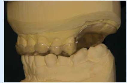
Abb. 5 ▲ Oberkieferschiene links: Der Freiendbereich wird durch einen Sattel zur besseren Dekompression des Kiefergelenkes ersetzt