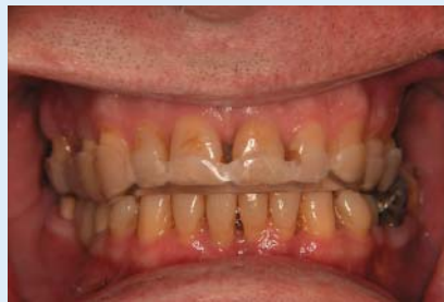
Abb. 7 ▲ Oberkieferschiene in situ