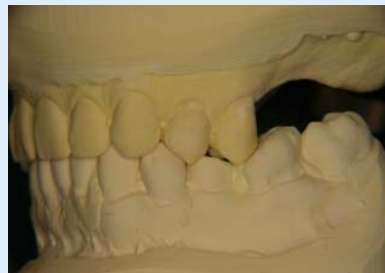
Abb. 2 ▲ Ausgangssituationsmodell HIKP links