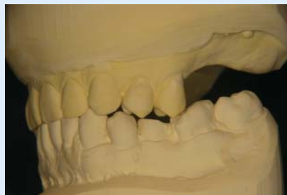
Abb. 10 ▲ Remontierte Modelle nach vier Physiotherapiesitzungen in Zentrik, links. Deutliche Dekompression im Kiefergelenk bei anteriorer Verlagerung des Unterkiefers